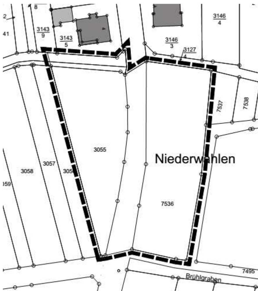
Abb. 1: Übersichtsplan

Der Geltungsbereich und dessen Lage sind im nachfolgenden Übersichtsplan dargestellt. Er umfasst die FI-St.Nrn 3055, 7536 und die Teilfläche der FI-St.Nr. 2993/5.